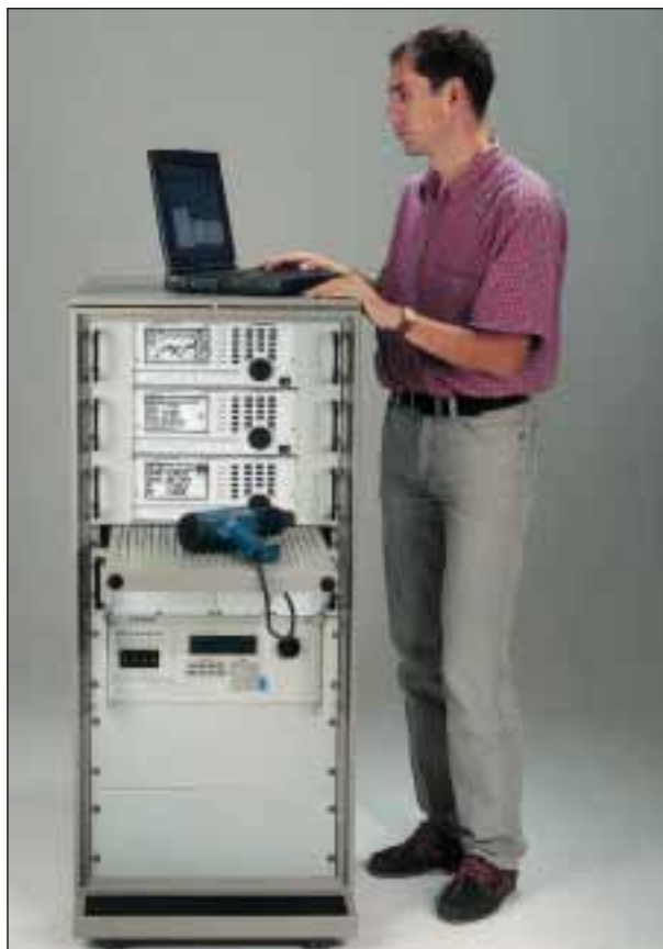
1 Dreiphasiges Prüfsystem SYS61K mit drei Präzisionsleistungsmessgeräten der Baureihe LMG 95

werden, ob die Produkte den Anforderungen des EMV-Gesetzes genügen. Die Normen zum EMV-Gesetz klassifizieren sowohl den zulässigen Grad elektromagnetischer Störaussendung als auch die Störfestigkeit unter elektromagnetischer Störeinwirkung. Die EN61000-3-2/-3 ist identisch mit der IEC61000-3-2/-3. Lediglich die